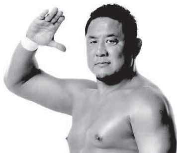
ながた ゆうじ 永田 裕志さん