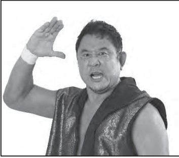
ながた ゆうじ 永田 裕志さん